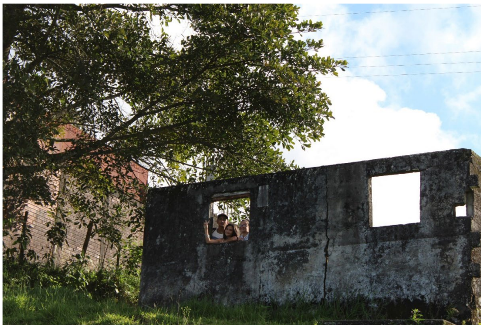
Figura 3. Antigua base paramilitar, vereda Venecia.