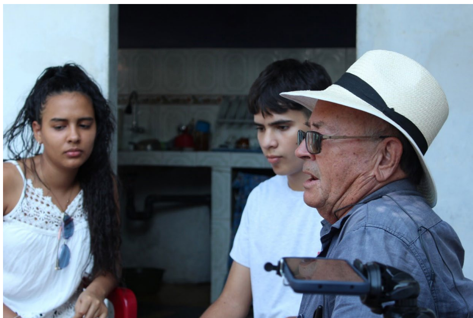
Figura 2. Producción Podcast sobre la fundación del corregimiento de San Diego.