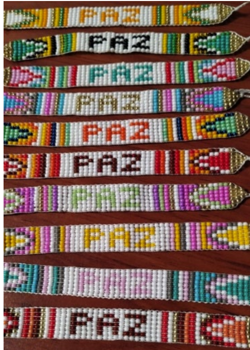
Figura 2. Las manillas de la Paz