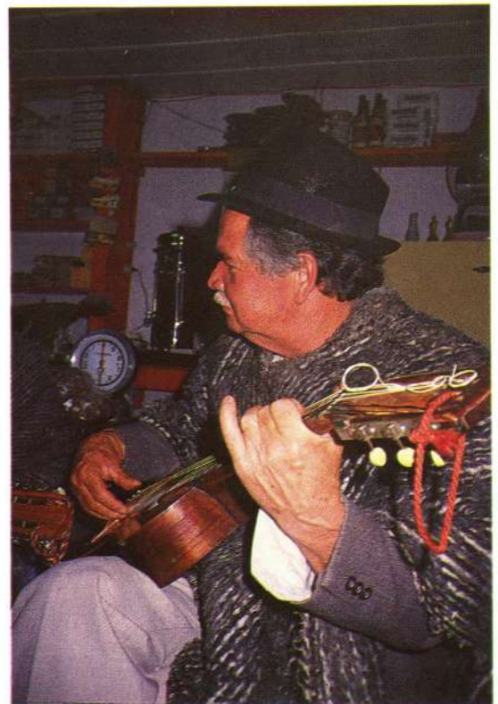
Arriba: Chirimía. A la derecha: Músico. Ambos de las parcialidades de Cañamomo y Lomapieta. En la pág. siguiente Muchacha con traje típico.